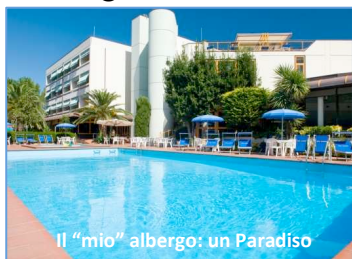
Il "mio" albergo: un Paradiso

Dopo il terremoto che ha colpito l'Abruzzo ad Aprile di quest'anno, mi sono sentito veramente triste e preoccupato per tutti gli abruzzesi, poi qualche giorno dopo i cari amici che gestiscono l'albergo in cui vado in vacanza hanno mandato