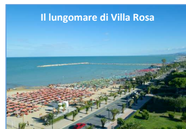
Il lungomare di Villa Rosa

una e-mail a mio papà in ufficio tranquillizzando tutti e dicendo che stavano bene. Questa cosa mi ha colpito perché nonostante questa tragedia hanno pensato di rassicurare le tante persone che erano preoccupate per loro. Dopo si sono rimboccati le maniche per rimettere tutto a posto il