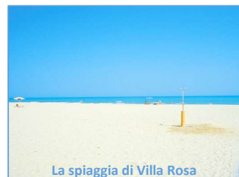
La spiaggia di Villa Rosa

Inoltre in Abruzzo si trovano cibi buonissimi e accoglienza speciale, ma soprattutto gente speciale .